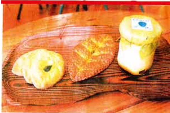
大矢野町の「アローム」が27日から登場させるモリンガイ(中央)と、既に販売しているサブレ(左)とプリン

△では、栄養機能補助食品としてモリンガの茶を販売中。四方田代表取締役は「モリンガは無農薬で、砂漠の中でも生きることができ植物なんです。オーストラリアでは、モリンガで砂漠化を止めようという動きもあるんですよ。環境にも体にもいいモリンガを天草の特産にしたい」と意欲的だ。問い合わせは0120・456・990まで。